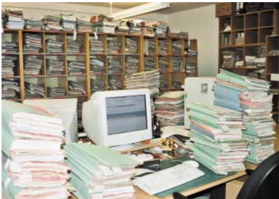
Dieser Arbeitsplatz ist verwaist – hoffentlich kommt heute ein Vertreter