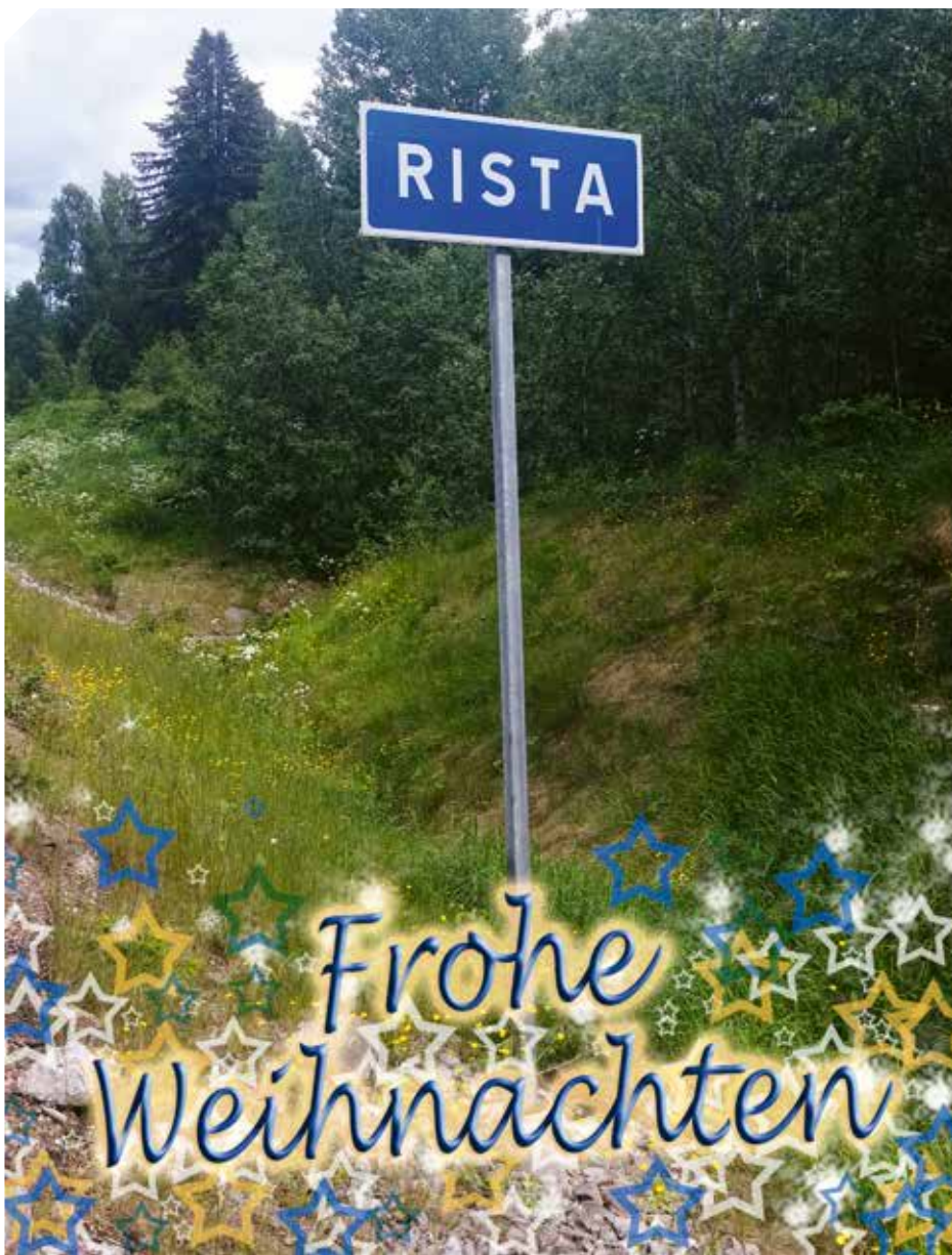
Gesehen in Schweden