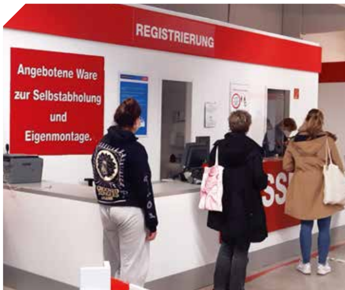
Impfzentrum Witten: DIY – Impfen?